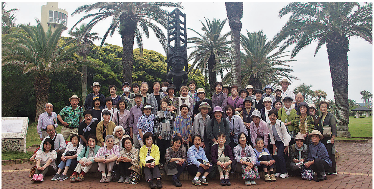
アロハガーデン館山

千城台東町自治会では6月6日 60名の皆様にご参加頂き館山バス旅行を開催しました。 ～アロハガーデン館山～伝平にて昼食～館山市立博物館～房総の駅とみうら～