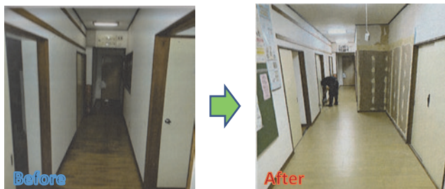
床フローリング張り