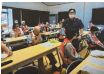
質問には質問者の近くで 回答