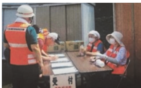
参加者(避難者) 受付

訓練を通しての経験が、いざという時の『備え』になった事と思います。参加された皆様、お疲れ様でした！