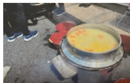
カレーの炊き出し準備