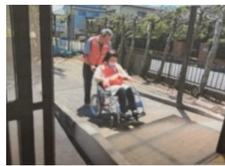
段差や勾配を登るのが難 しい事を体験しました