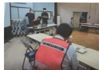
訓練参加者による 119番通報訓練