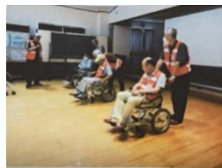
要救助者の車椅子 への固定訓練