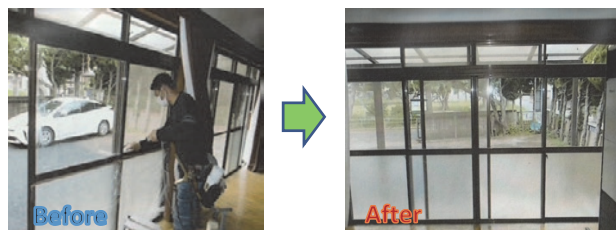
飛散防止フィルム貼り