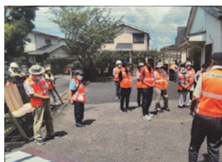
停電を想定した発電機での外灯の点灯訓練