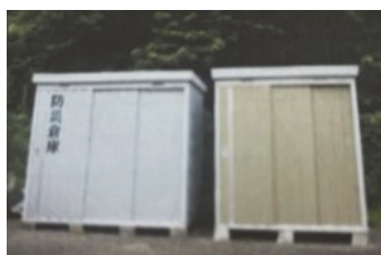
自治会館敷地内の 防災倉庫