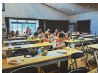
モグモグタイムで 一休み