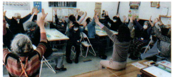
みんなで健康体操