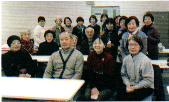
ボランティアの方々