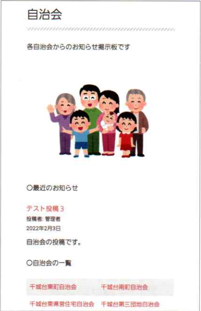
2.2 サブ画面 (3) 自治会