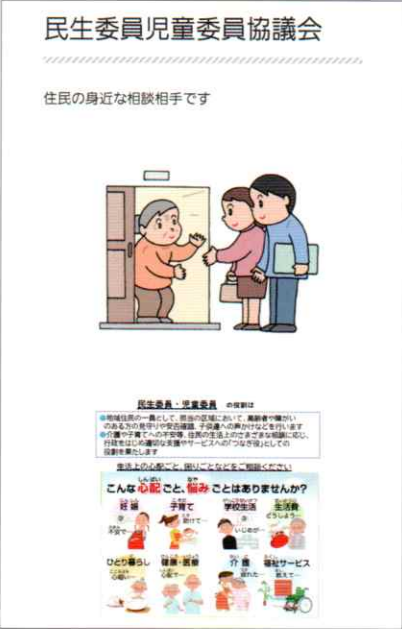
2.2 サブ画面 (2) 民生委員児童委員協議会

HP の基本のホーム画面は関連する 4 つの団体と当地域を紹介するための 5 つの枠で構成しています。関連する団体は社協、民児協、自治会、あんしんケアセンターです。それぞれの枠を指で触れると次の画面（サブ画面）に移動します。