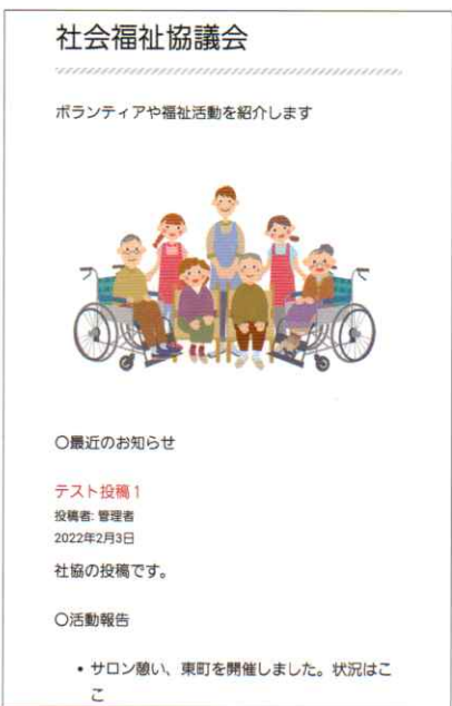
2.2 サブ画面 (1) 社会福祉協議会