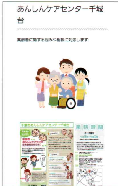
2.2 サブ画面 (4) あんしんケアセンター

HP に関するご意見や要望、投稿したい情報等を提案する場合の投稿フォームです。必要事項を記入しメールで連絡下さい。問い合わせの内容によっては回答に時間を要する場合があります。