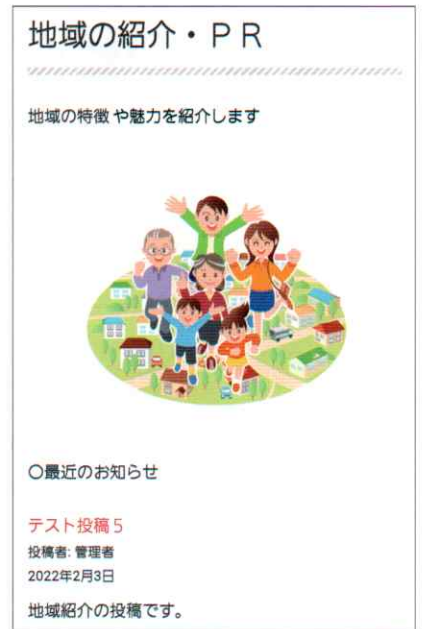
2.2 サブ画面 (5) 地域の紹介・PR